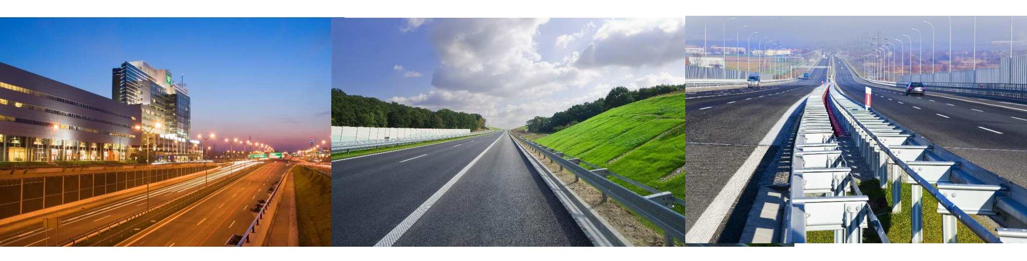
A2 highway section Stryków-Konotopa