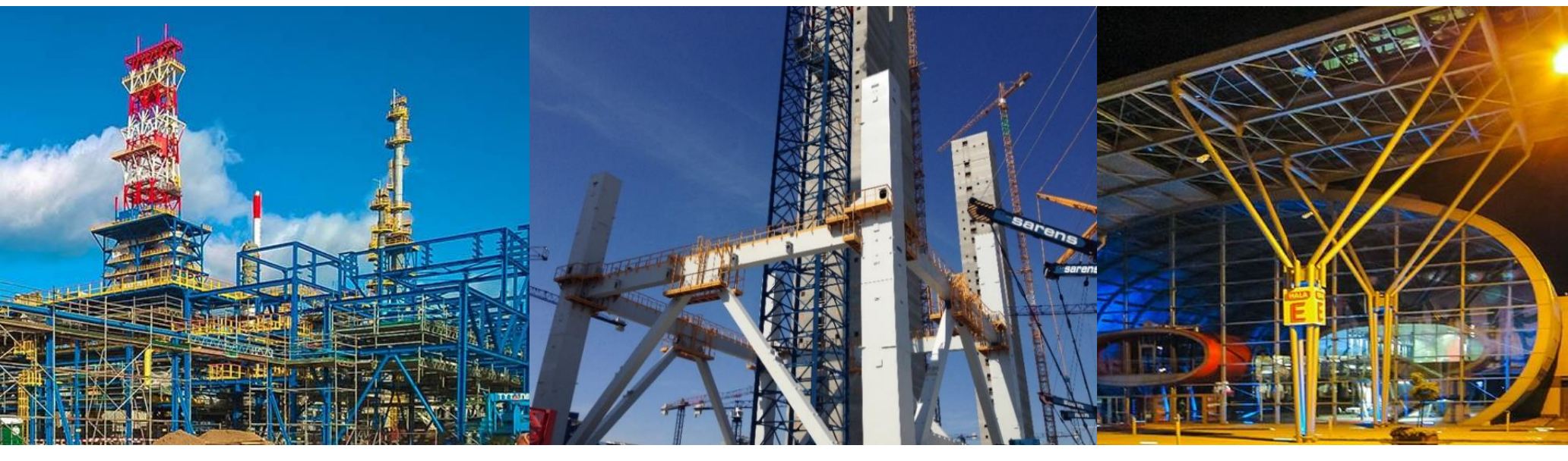
Power plants, petrochemical industry